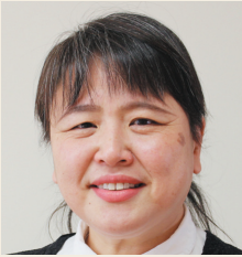
秋草学園短期大学 秋桜会 会長