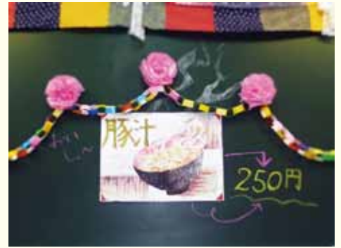
▲今年の秋桜会の出し物は、1杯 250 円の豚汁を提供しました。好評で、あっという間に完売しました！