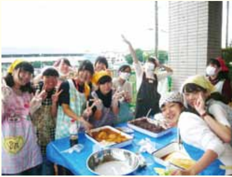
▲校門前では、学生たちの元気な餅つきの声で秋草祭は始まりました！